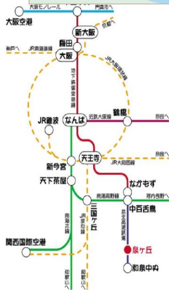
泉ヶ丘駅からの経路